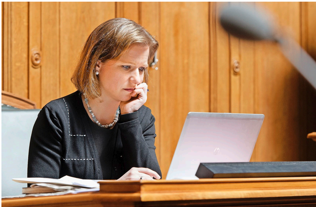
Nationalrats-Vizepräsidentin Markwalder während der Parlamentsdebatte vergangene Woche.